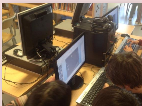
Alunos do 3º e 4º ano a realizar trabalhos, no âmbito do projeto e desenvolvendo as literacias dos média e informação.