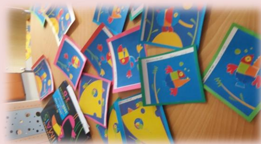
Expressão plástica (montagem de um animal); trabalho final após a leitura do livro " Bichos, Bichinhos e Bicharocos " e exploração do tema "os animais (2º ano)".