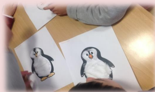
Leitura do livro " Pinguim ", trabalhos realizados a partir da história (Pré-Escolar e UAM), interpretação de imagens e trabalhos realizados (1º ano).