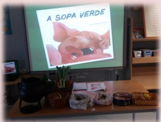
Exploração do livro " A Sopa Verde " que teve como objetivo promover a alimentação saudável (Pré-Escolar, 1º Ciclo e UAM)