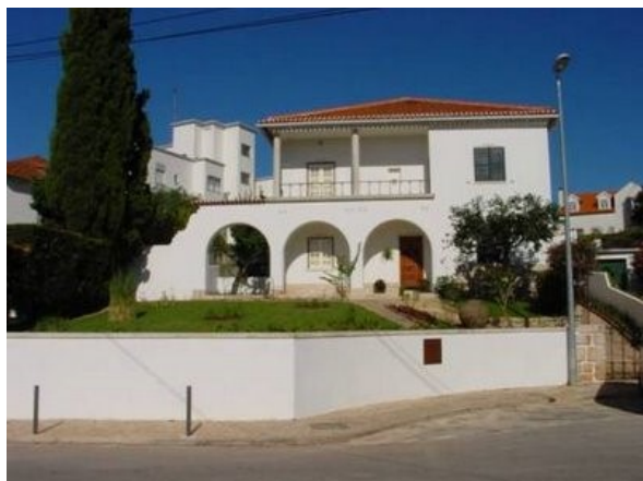
Casa museu em Coimbra