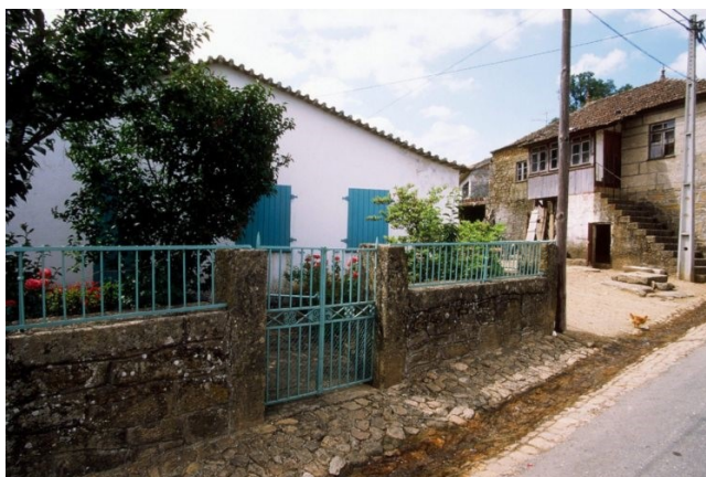
Casa da terra natal de Miguel Torga